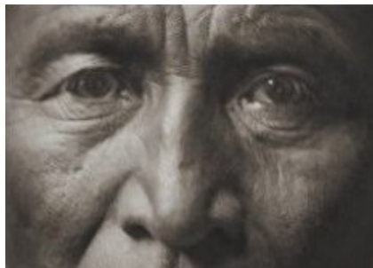
Grandfather „Stalking Wolf“